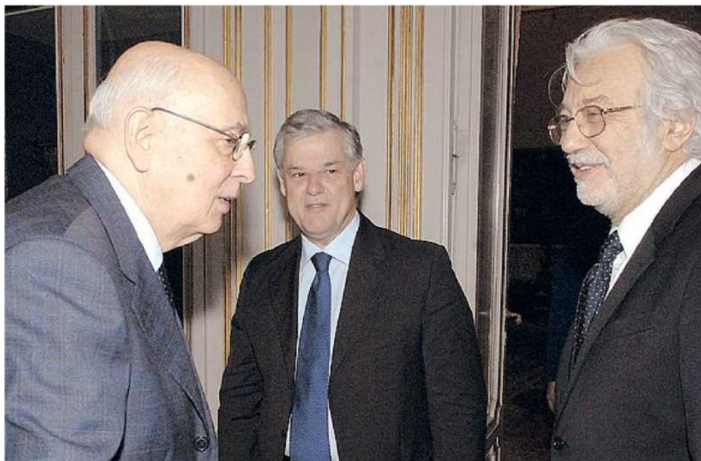
A ROMA Luca Ronconi al Quirinale per l'incontro con l'allora presidente della Repubblica Giorgio Napolitano. Era il 9 gennaio 2008. Con loro, al centro, il direttore del Piccolo teatro di Milano Sergio Escobar. La notizia della morte di Ronconi ha suscitato immediate reazioni di cordoglio e commozione in tutta Italia.